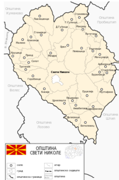
Слика 2: Населени места во Општината

Според пописот на населението и домаќинствата во Република Македонија од 2021 година, општина Свети Николе има 15.320 жители (Вкупно резидентно население) од кои 13.746 (74,31%) живеат во градот Свети Николе, а останатите (25,69%) живеат во 32 рурални населени места. Населението од општината живее во 5 120 домаќинства, односно 6 812 станопви. Густина на населеност во општината изнесува 38,30 жит/км 2 . Најголем дел од населението во општината се Македонци 14.170 (92,49%), додека малцинствата се Власи 134 (0,87%), Турци 57 (0,37%), Роми 45 (0,29%), Срби 33 (0,22%) и други 47 (0,31%).